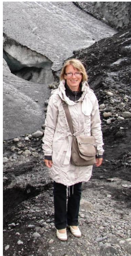
Meie kooli direktor Islandil

Kunagi tahan õppida aiandust, ka fotograafiat. Olen unistanud mõne pilli õppimisest, samuti hispaania keele õppimisest.