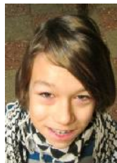
Gabriel: Saksa lambakoer