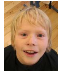
Kristen: Siberi husky