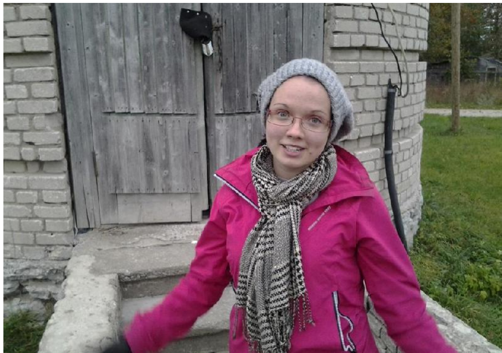
Bente omas elemendis