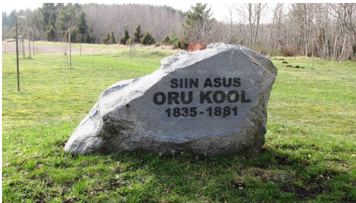
Oru kooli esimese hoone mälestuskivi. Kaardil nr 5.

Oru kool asutati 1835. aastal Nõrava külas Tänavotsa talus. 1880. aasta loendusel õppis koolis 23 last. Oma maja ei olnud koolil kuni aastani 1881. Siis koliti linnulennult kilomeetri kaugusele asuvasse uude majja, mis oli ehitatud spetsiaalselt koolimajaks. Vanast majast sai Tänavotsa talu elamuhoone. Tänapäevaks on kivihoone lammutatud. Enamuse ülalpidamiskuludest kattis kogukond, väikese osa andis ka mõis. Selle nimega tegutses kool aastani 1921. Pärast seda sai koolihoonest taluelamu. Samas majas asus ka kolhoosi Sotsialismi Tee kontor. 2012. aastal oli maja kasutusel elamuna.