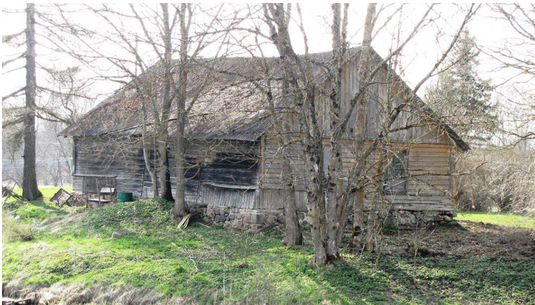
Tuhala kooli kolmas hoone. Kaardil nr 3.