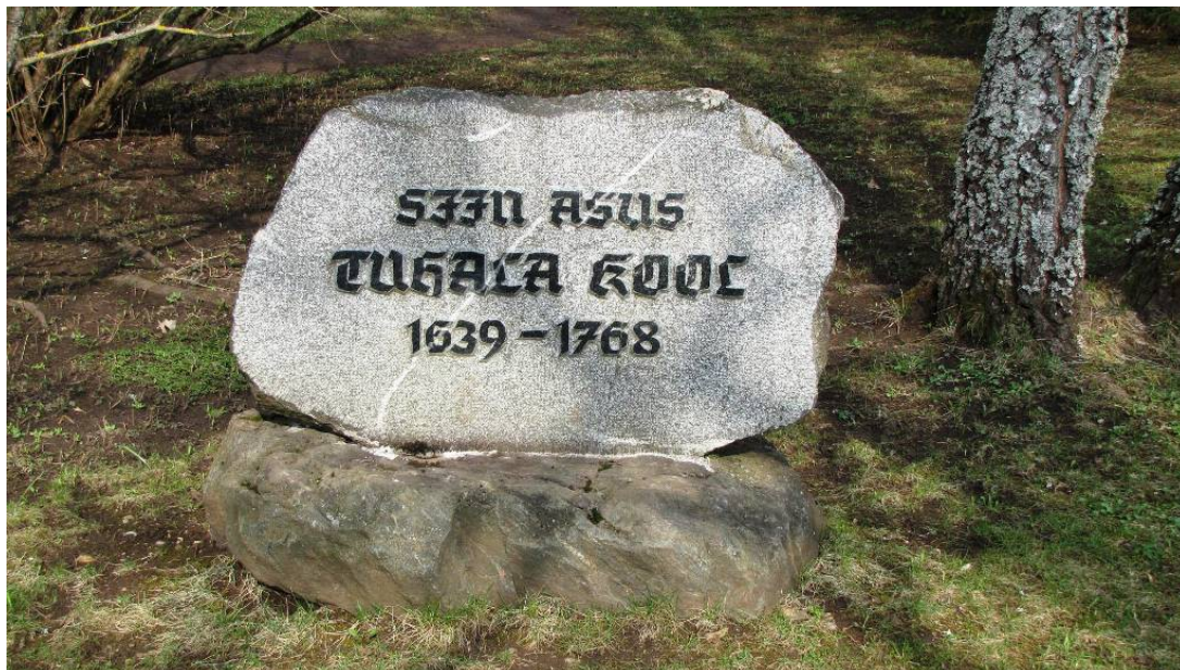
Esimese Tuhala kooli hoone mälestuskivi. Kaardil nr 1.

Oru põhikooliga seotud koolimajade asukohad