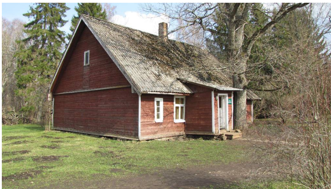
Tuhala looduskeskus. Selle maja asemel oli esimene Tuhala kooli hoone. Kaardil nr 1.