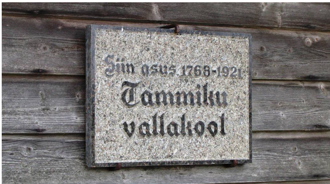
Tammiku vallakoolile viitav mälestustahvel Tammiku teise koolihoone seinal. Kaardil nr 4 ja 4a.