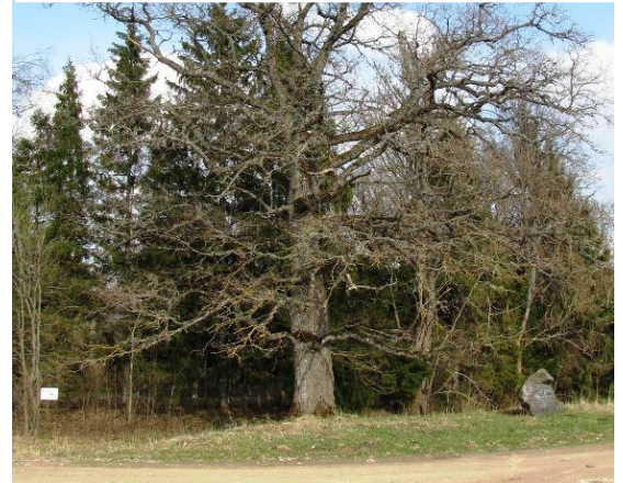
Tuhala teise koolihoone mälestuskivi. Kaardil nr 2.