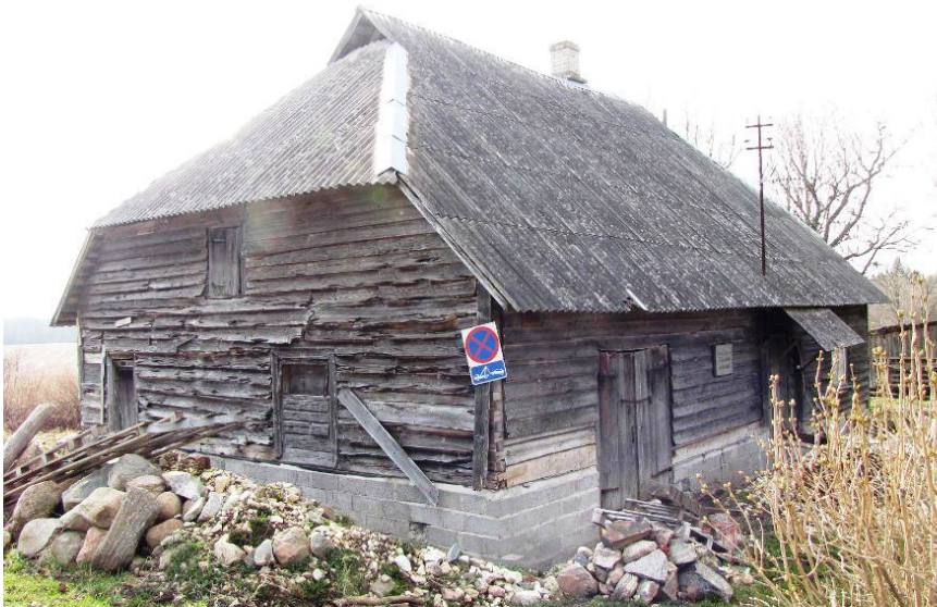
Tammiku kooli teine hoone. Kaardil nr 4 ja 4a.